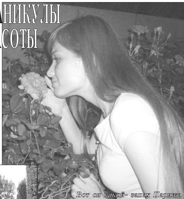
Вот он какой- запах Парижа

- Ты бы согласилась участвовать еще раз в конкурсе мисс РХТУ?