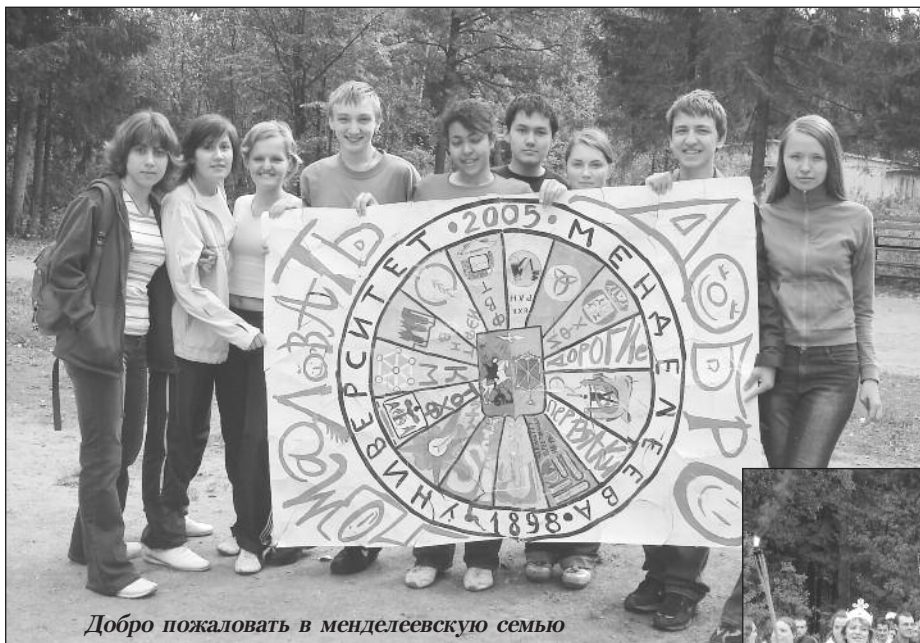
Добро пожаловать в менделеевскую семью

расное действо. На «деканской оперативке» в кабинете ректора было внесено предложение возродить церемонию «Посвящения в Студенты». Деканы всех факультетов единогласно ответили: «ДА!» В тот же день началась подготовка: были выбраны дни посвящения (16, 17, 18 сентября и 2 октября), утверждена очередность посвящаемых факультетов, разработан сценарий праздника, который должен