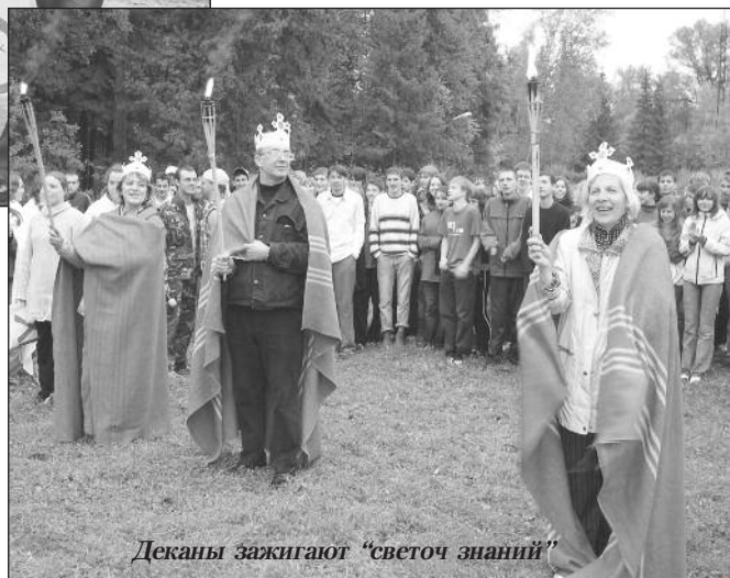
Деканы зажигают "светоч знаний"

восторженной шумной толпой ввалились первокурсники. После организационного собрания и легкого завтрака, разделившись на команды (учебные группы) перваки взбудораженно носились по лагерю, в разных частях