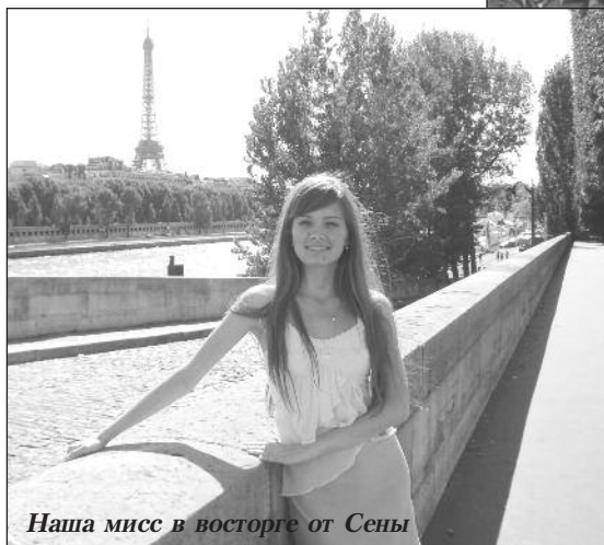
Наша мисс в восторге от Сены