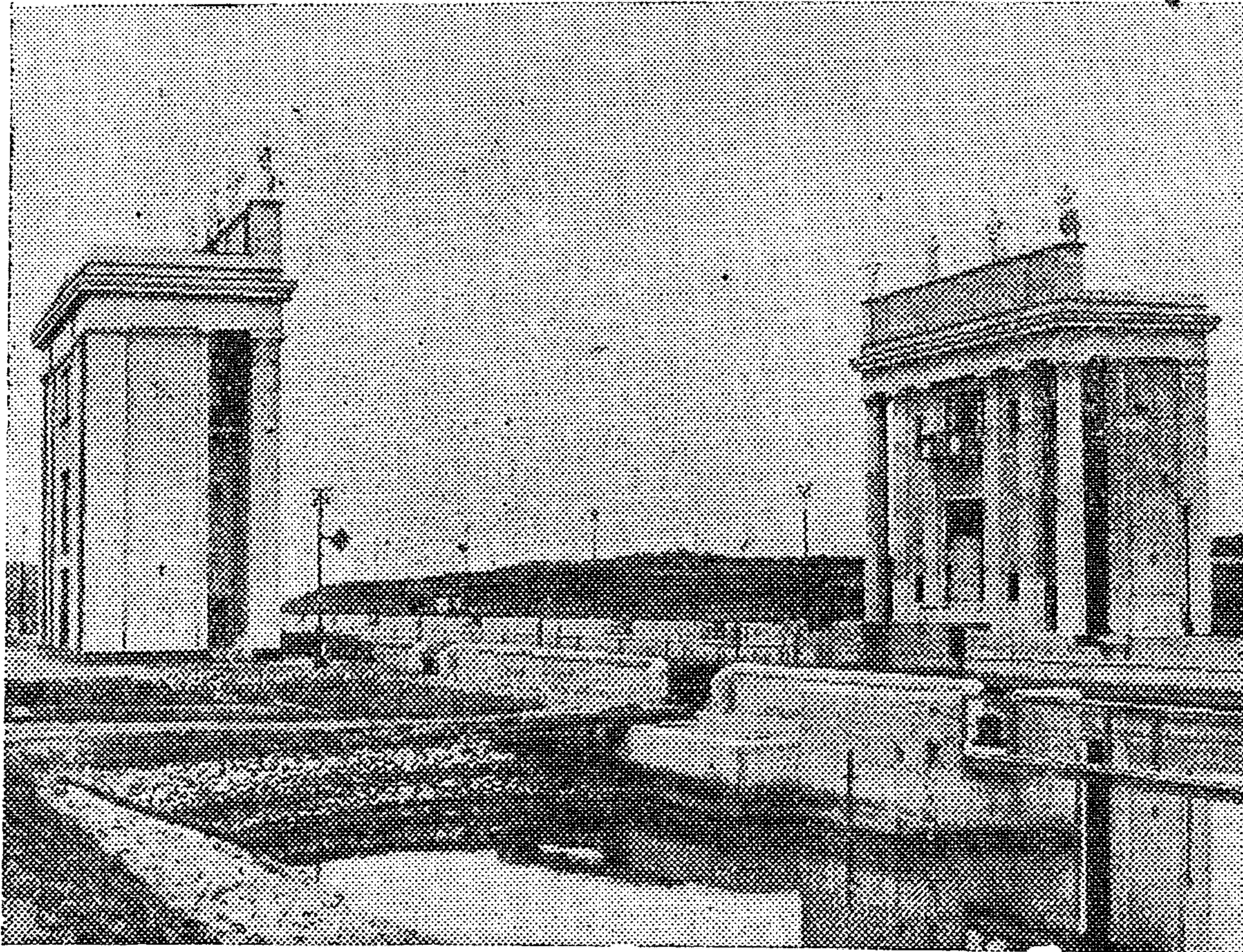
Шлюз канала Москва—Волга.