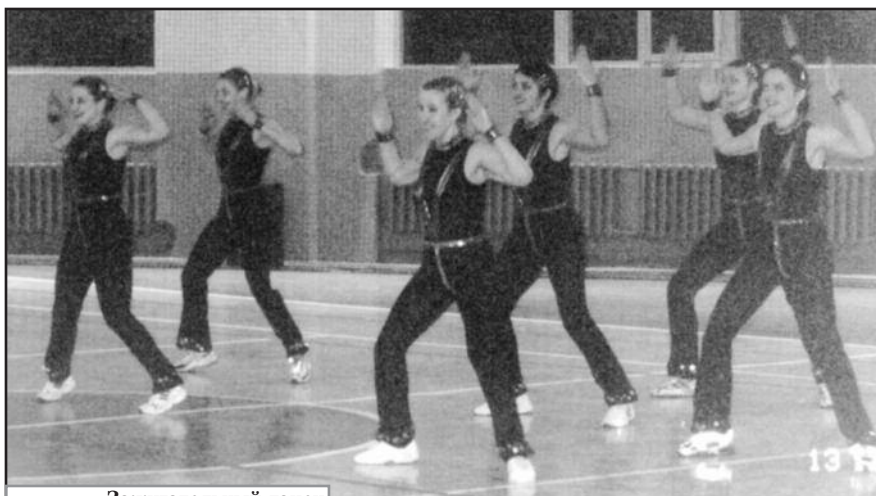
Зажигательный танец спортсменов клуба "V-стиль"

Первая подача, прием, пас, удар... Игра началась и захватила всех, и участников, и зрителей. Мастера, нет, гроссмейстеры Химии и Волейбола демонстрируют все пре-