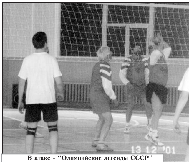
В атаке - "Олимпийские легенды СССР"