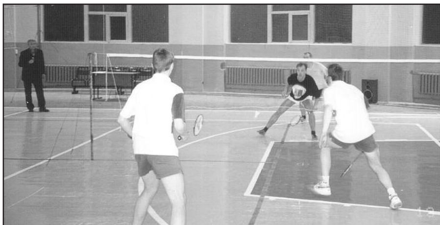
Показательная парная встреча бадминтонистов, комментирует проф. М.И.Штильман

А.Дудоров, член редколлегии "Менделеевца"