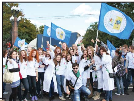
22 сентября на территории Тушинского комплекса РХТУ прошло «Посвящение в студенты 2012»

Посвящаем! Посвящаем! Небо мрачное прощаем! Луки мокрые прощаем! Посвящаем! Посвящаем!