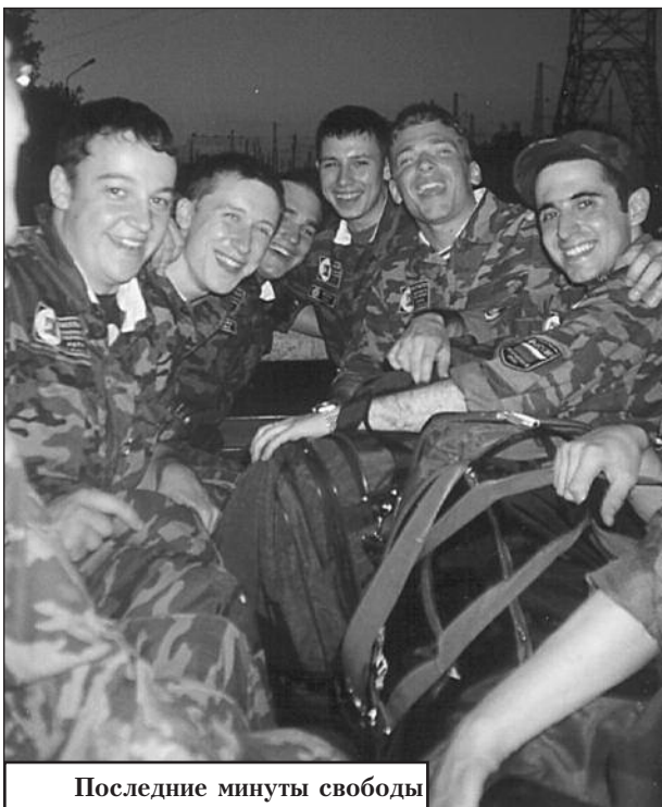
Последние минуты свободы

2-ое мероприятие. Чистый, побритый и свежесподшившийся личный состав поднимают на вечернюю прогулку, так называется этот прикол: чистый, побритый и свежесподшившийся личный состав "одевают" в далеко не "альпийской свежести" форму и в еще