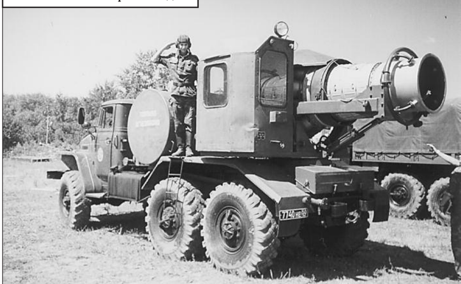
ТМС-65 На страже Родины

Зарядка - если тебя напрягает физическая подготовка, то тебе вообще не место в вооруженных силах или даже