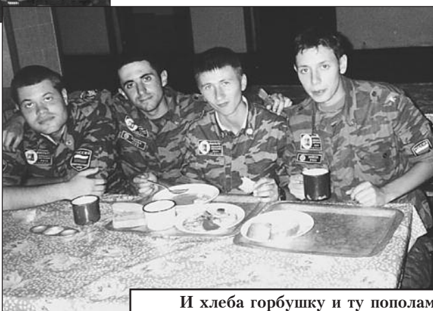
И хлеба горбушку и ту пополам