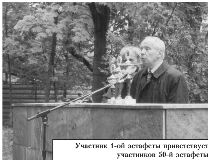
Участник 1-ой эстафеты приветствует участников 50-й эстафеты