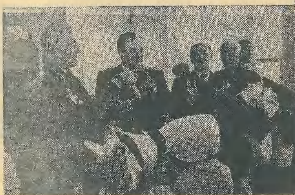
Ветераны в гостях у пионеров.

Д. ЛЕЛЮШЕНКО, генерал армии, дважды герой Советского Союза.