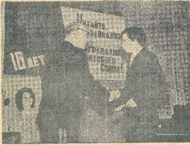
Вручение паспортов молодежи района.

Новая Конституция отразила изменения, которые произошли в нашей стране за 40 лет социалистического развития. В Конституции значительно расширены права граждан СССР, что свидетельствует о дальнейшем углублении социалистической демократии в нашей стране. Особое внимание в новой Конституции уделено подрастающему поколению, юным гражданам страны Советов. В частности, в ней записано: в СССР существует единая система образования, которая служит коммунистическому воспитанию, духовному и физическому развитию молодежи, подготовке ее к труду и общественной деятельности. Образование в СССР бесплатное. По новой