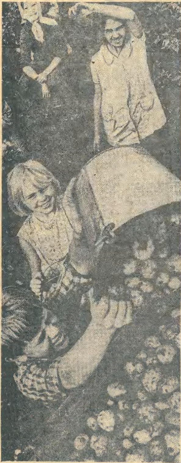
Трудовое лето школьников