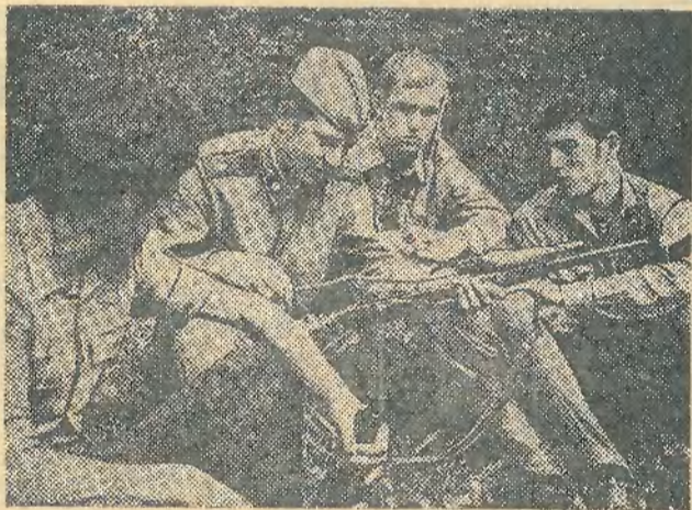
Участники игры «Зарница» на привале.

История знает много славных подвигов юных героев — пионеров и комсомольцев.