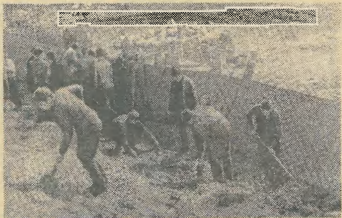
С большим подъемом прошел коммунистический субботник в группах И-32, О-22, И-26, И-23, О-24: все студенты трудились ударно.

В. САВАСТИНКЕВИЧ, преподаватель военной кафедры.