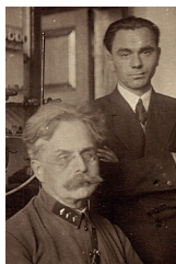
П.П. Шорыгин и А.В. Топчиев академики АН СССР