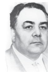
С.В. Кафтанов 1962-1973 гг.