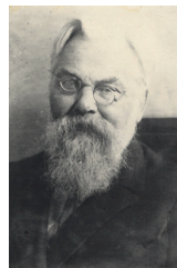
Е.И. Орлов академик, легендарный силикатчик