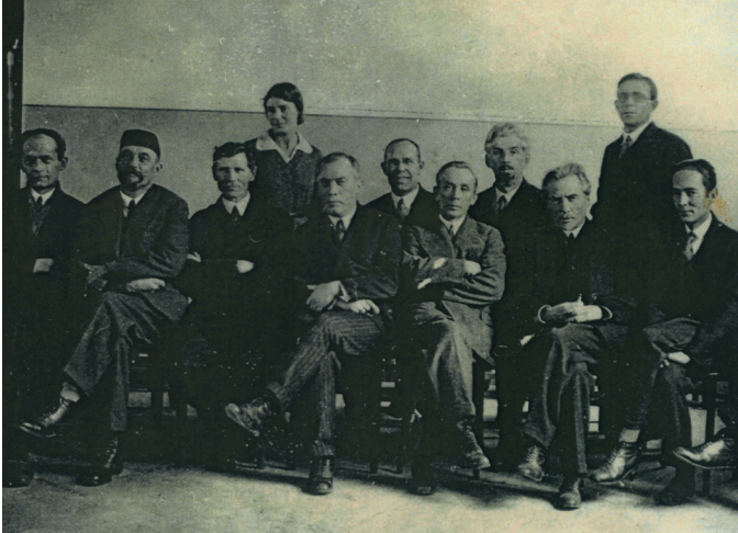
Ученые МХТИ 1930-е годы